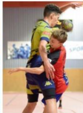
Celles / Lezay (moins de 13 ans)