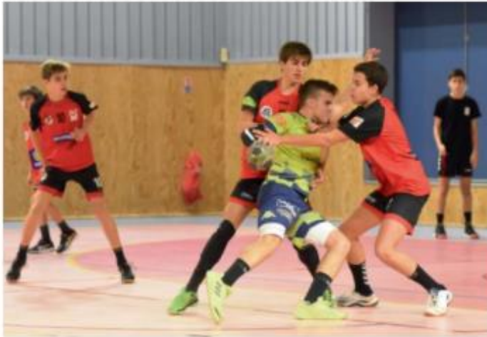
Niort / ETEC