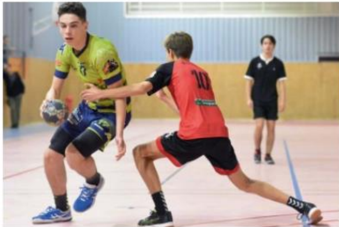
Niort / ETEC

Le défenseur qui touche le joueur marque un point, et 2 points s'il touche la chasuble.