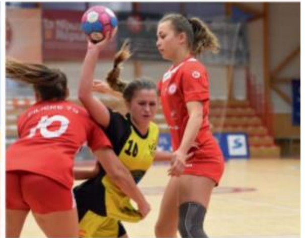
Filière 79 / Mios (moins de 18 ans)