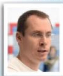
Par Boris Thiébault Conseiller Technique Ligue AURA

On a souvent dissocié la formation des jeunes joueurs et des jeunes arbitres au sein de nos instances. Et pourtant, tous les week-ends sur les terrains les 2 publics/acteurs sont mis à contribution à travers le jeu. Chacun a certes un rôle mais si nous prenons le temps d'analyser les comportements attendus on se rend compte que la formation est commune (points communs).